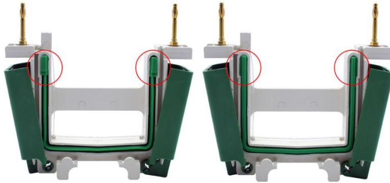
图2. 碧云天、Bio-Rad等公司的电泳槽U型硅橡胶密封条的突起结构图。由于碧云天的BeyoGel™ Elite PAGE预制胶的该部位是平的，使其兼容几乎所有厂家的小型胶电泳槽，所以电泳时须将具有突起结构的硅橡胶密封条(左图)取出后反过来安装(右图)，使其没有突起的平滑面朝外，从而防止漏液。